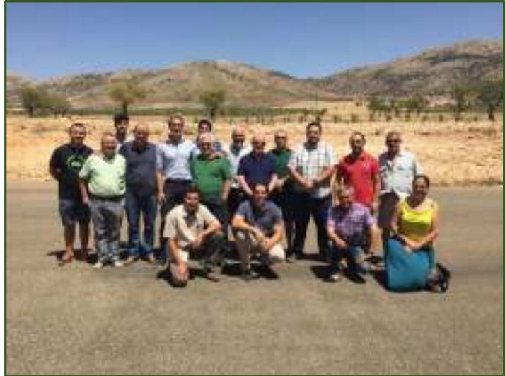
Socios de La Almendrehesa