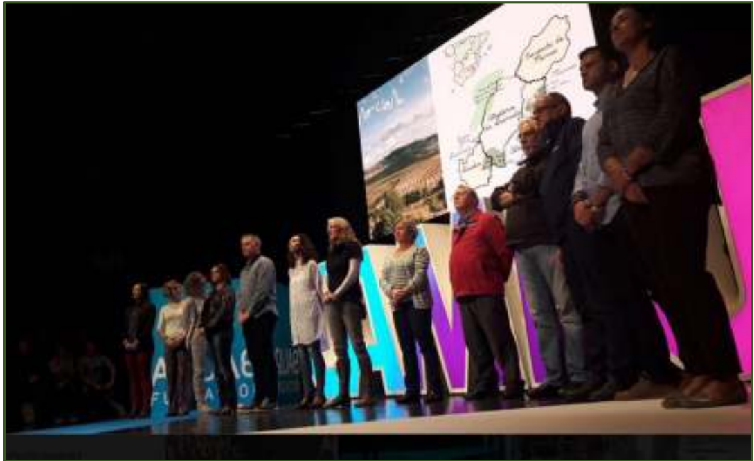
Presentación de AIVelAl en la Gala de la Fundación Aquae 21 de octubre de 2016