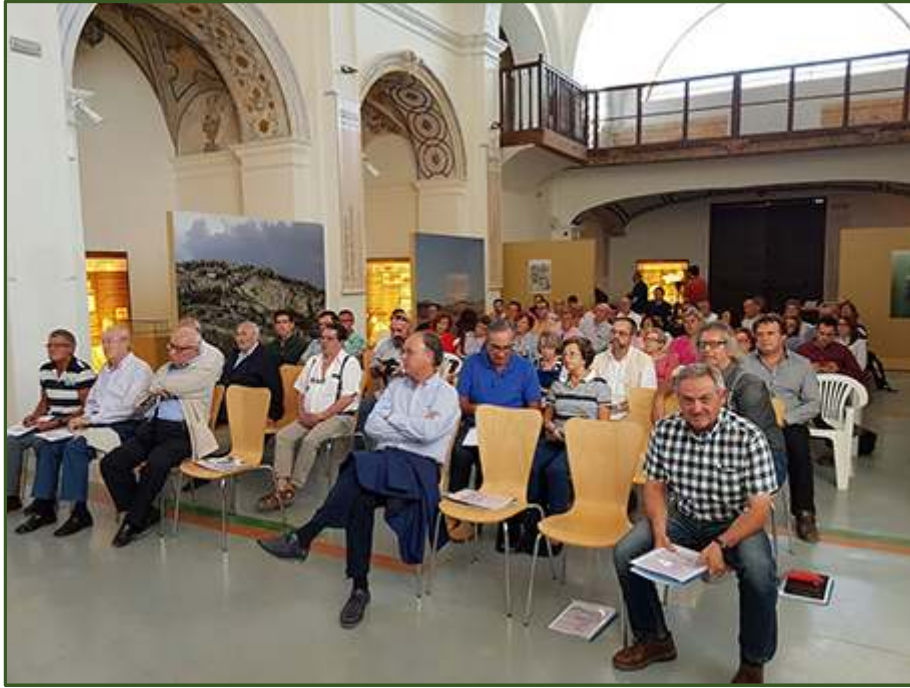
Asistentes al I Coloquio AlVelAl