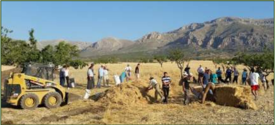
Participantes de uno de los talleres de Alvelal.

Además, ha colaborado con entidades públicas y privadas en otras acciones formativas: