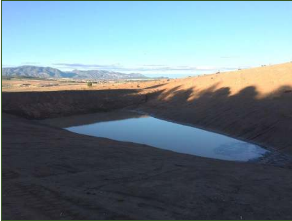
Charcas captadoras de agua de lluvia en la finca de un socio.