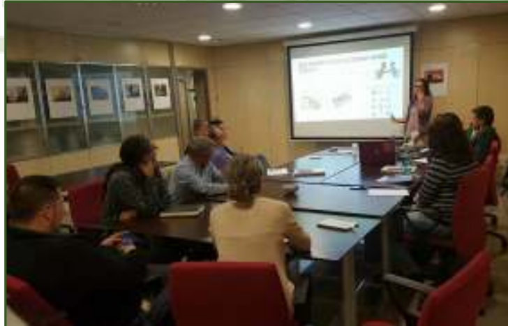
Reunión Preparativa del Grupo Operativo 4Retornos