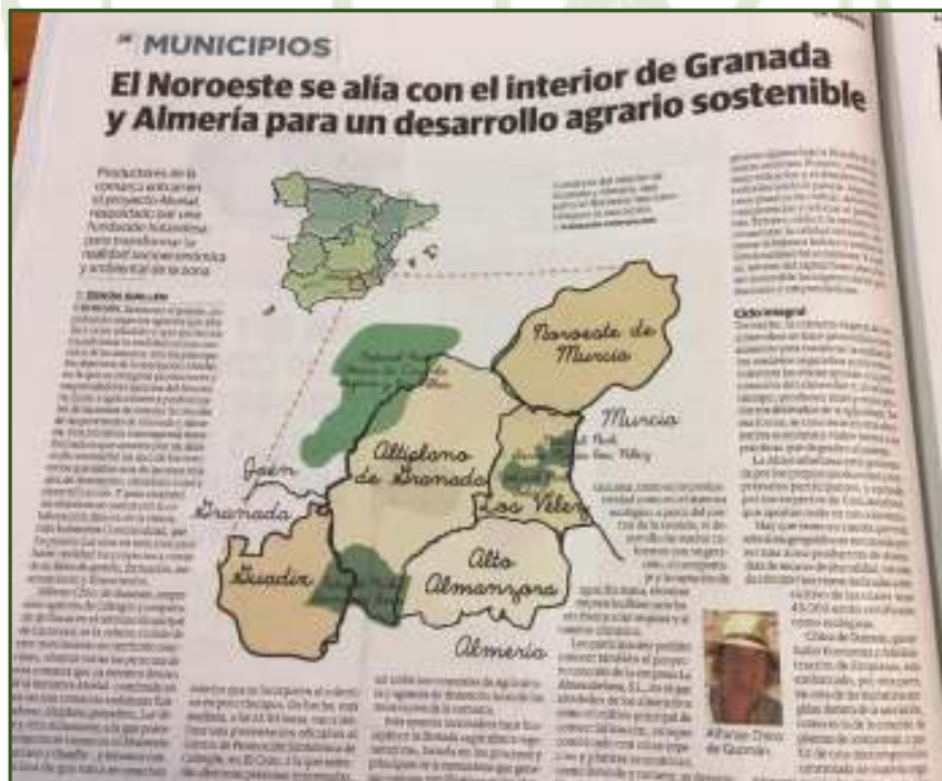
Imagen de noticia de Alvelal en La Verdad de Murcia. 9 de noviembre de 2016