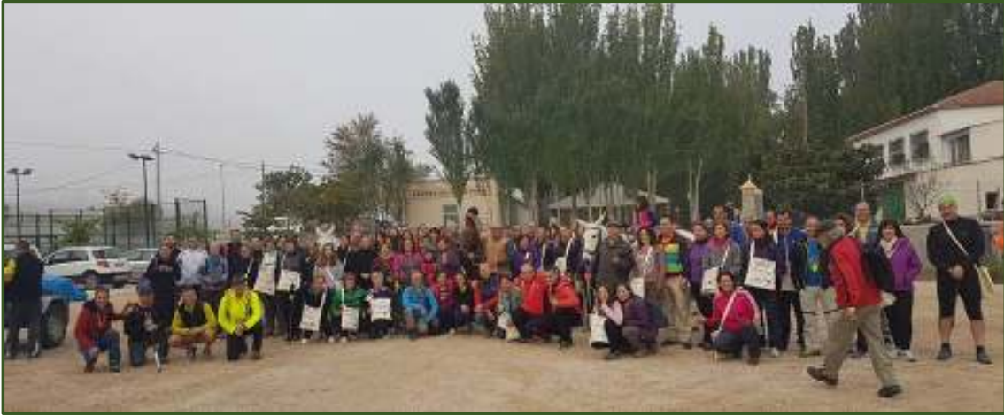
Participantes al inicio de la Ruta del Estraperlo.