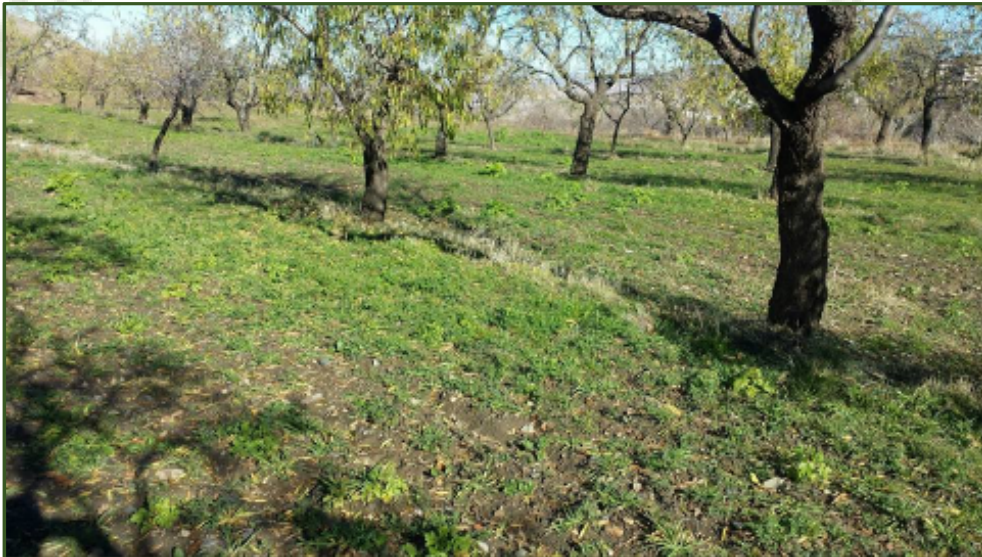
Cobertura vegetal en la finca de almendros de un socio en Ferreira

Además se han realizado las siguientes actuaciones: