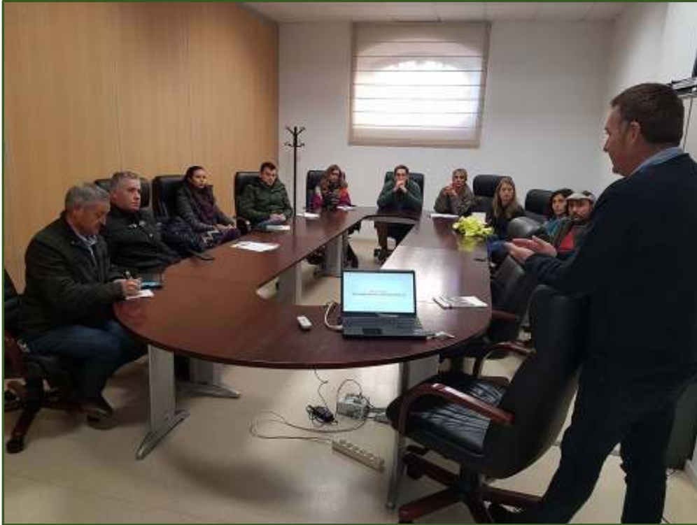
Reunión de la Junta Directiva de AlVelAl el 9 de Enero en la sede del GDR de Guadix